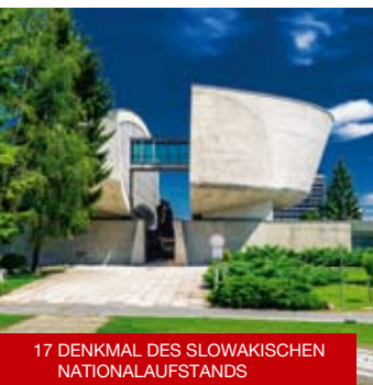
17 DENKMAL DES SLOWAKISCHEN NATIONALAUFSTANDS

16 Die am Ende des 19. Jahrhunderts im Stil der Neorenaissance erbaute Dominik Skutecký Villa präsentiert das Werk eines der wichtigsten Darstellers der realistischen Malkunst in Mitteleuropa an der Wende des 19. zum 20. Jahrhunderts – Dominik Skutecký. www.ssgbb.sk