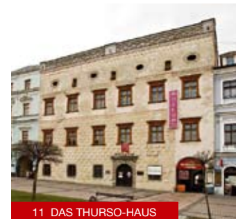
11 DAS THURSO-HAUS