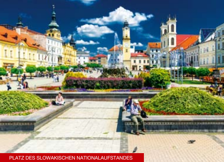
PLATZ DES SLOWAKISCHEN NATIONALAUFGSTANDES

Über Banská Bystrica: Die Besiedlung der Lokalität Banská Bystrica (Neusohl) an den Ufern des Flusses Hron reicht kontinuierlich bis in die Urzeit. Schon die Bewohner der slawischen Siedlung Bystrica beschäftigten sich mit dem Abbau von Erzen im Tagebau. Dank dem Rohstoffreichtum stieg die Bedeutung der Siedlung soweit an, dass sie 1255 vom ungarischen König Béla IV. durch die Erteilung von umfangreichen Privilegien zur Stadt erhoben wurde. Die goldene Ära in der Geschichte von Banská Bystrica war das 15. und 16. Jahrhundert, als hier die erfolgreiche Thurso-Fugger'sche Kupfergesellschaft tätig war. Ein bedeutendes Kapitel in der neuzeitlichen Geschichte der Stadt schrieb der Slowakische Nationalaufstand im Jahre 1944, als Banská Bystrica zum Zentrum des antifaschistischen Widerstands wurde.