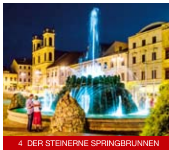
4 DER STEINERNE SPRINGBRUNNEN