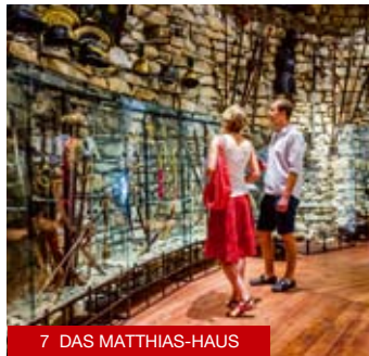
7 DAS MATTHIAS-HAUS