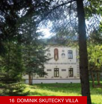
16 DOMINIK SKUTECKÝ VILLA