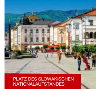
PLATZ DES SLOWAKISCHEN NATIONALAUFGSTANDES

10 Das Rathausgebäude entstand im 15. Jahrhundert durch den Zusammenschluss von zwei eigenständigen Gotik-Häusern und diente fast 250 Jahre lang als Sitz des Stadtverwaltung. Hier blieben mehrere kostbare Elemente erhal-