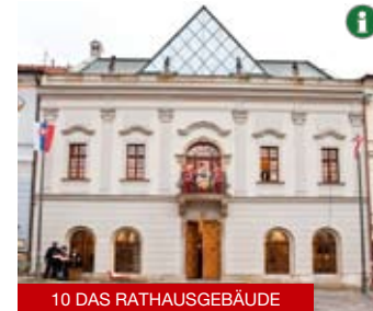
10 DAS RATHAUSGEBÄUDE