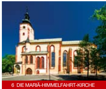
6 DIE MARIÄ-HIMMELFAHRT-KIRCHE