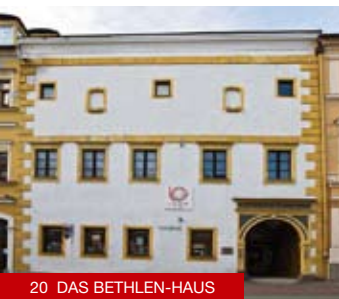
20 DAS BETHLEN-HAUS

20 Das Bethlen-Haus wurde dadurch bekannt, dass hier 1620 der siebenbürgische Fürst Gabriel Bethlen vom ungarischen Landtag zum König von Ungarn gewählt wurde. Heute befindet sich hier die Mittelslowakische Galerie, die hier regelmäßig verschiedene Ausstellungen, die auf moderne oder zeitgenössische Kunst ausgerichtet sind, veranstaltet. www.ssgbb.sk