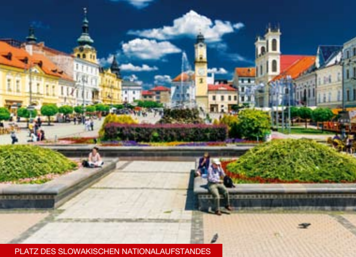
PLATZ DES SLOWAKISCHEN NATIONALAUFGSTANDES