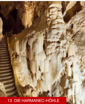
13 DIE HARMANEC-HÖHLE

11 Špania Dolina: Das malerische Bergmannsdorf wurde zum Denkmalsreservat der Volksarchitektur erklärt. Im Ort dominiert die frühgotische Kirche der Verwandlung des Herren aus dem Jahre 1254. Auf dem Platz finden Sie die bedeutendste Bergbau-Sehenswürdigkeit – den Klopfturm aus dem 16. Jahrhundert, in dem sich das Museum für Spitzen befindet, sowie das historische Gebäude der ehemaligen Bergverwaltung (heutiges Gemeindeamt), in dem das Museum „Unser Kupfermuseum“ untergebracht ist. www.spaniadolina.sk