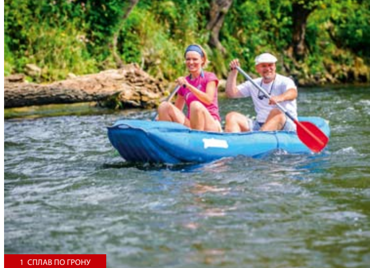
1 СПЛАВ ПО ГРОНУ