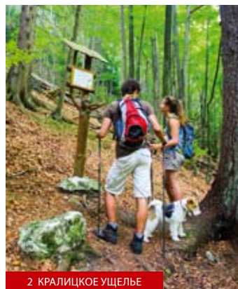
2 КРАЛИЦКОЕ УЩЕЛЬЕ