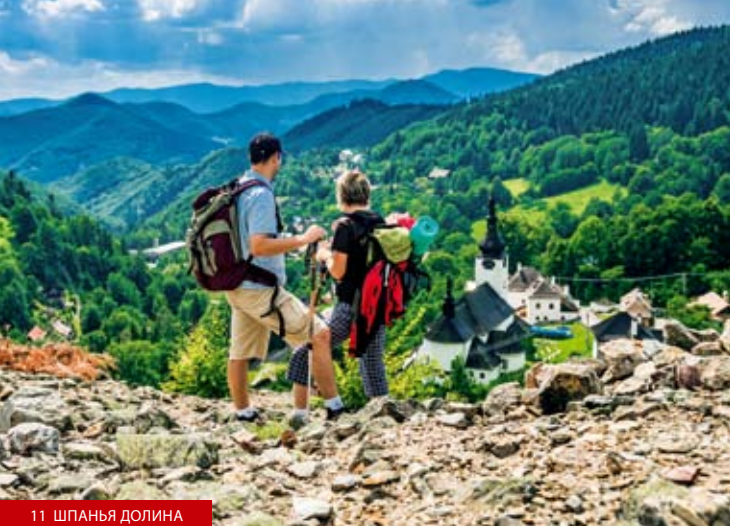
11 ШПАНЬЯ ДОЛИНА