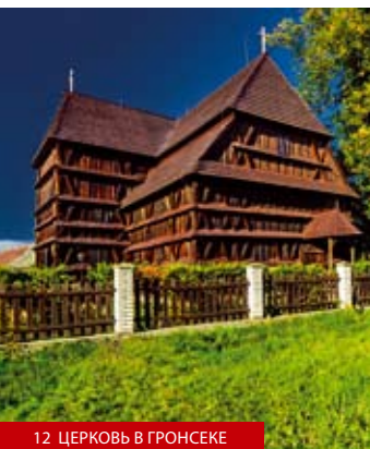
12 ЦЕРКОВЬ В ГРОНСЕКЕ