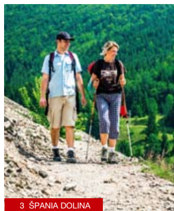
3 ŠPANIA DOLINA

1 Spływ Hronem – weźcie udział w świetnej zabawie z dodatkiem odrobiny adrenaliny spływając rzeką Hron. Przystań na Mlynčoku w Slovenskej Lupči organizuje spływy Hronem, wypożycza i przewozi łodzie wraz z wyposażeniem. www.splavhrona.sk