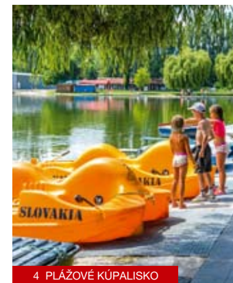
4 PLÁŽOVÉ KÚPALISKO