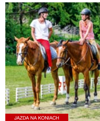
JAZDA NA KONIACH

Turystyka rowerowa – w okolicy Bańskiej Bystrzycy są setki kilometrów tras dla rowerzystów, którzy chcieliby aktywnie wypocząć. Od czerwca do września, w weekendy i święta do ulubionych celów turystyki rowerowej kursują wygodne „klobusy”. www.dpmbb.sk