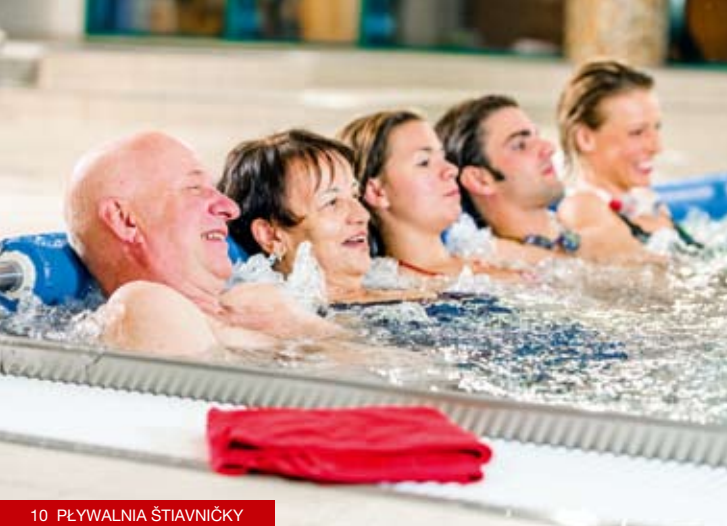
10 PŁYWALNIA ŠTIAVNIČKY