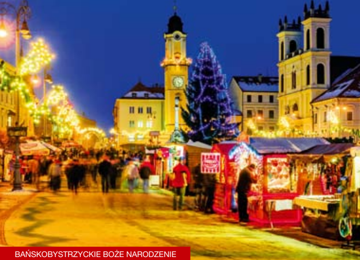
BAŃSKOBYSTRZYCKIE BOŻE NARODZENIE