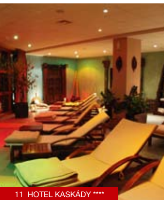
11 HOTEL KASKÁDY *****